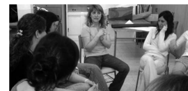
Les reunions del grup d'una classe amb les famílies són orientadores i profitoses

...reservar un breu espai de temps abans de la reunió per una primera presa de contacte i fer les salutacions i presentacions, i trencar així el glaç, cosa que permetrà que els pares es trobin còmodes des de l'inici i afavorirà el diàleg i la participació.