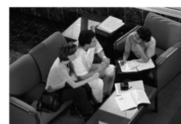
L'entrevista amb els pares ha de tenir caràcter de conversa

Hi ha una gran varietat de temes que es poden tractar amb els pares durant una entrevista com per exemple: