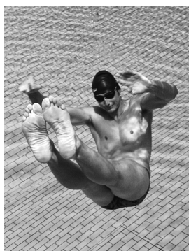
En un salt de trampolí, la coordinació és molt important

...està immers en tots els fenòmens de la natura? Podeu pensar-la com una habilitat vital?