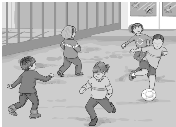
FIGURA 1.1. La relació amb els altres propicia el desenvolupament integral dels infants

A fi d'aplicar aquests principis, el mètode proposa dos tipus de sessions didàctiques que inclouen jocs i activitats d'expressió així com sessions psicomotrius en què es fan exercicis de coordinació, de percepció i coneixement del propi cos, d'ajustament corporal (actituds, problemes, etc.), exercicis de percepció temporal i exercicis de percepció de l'espai d'estructuració espaciotemporal.