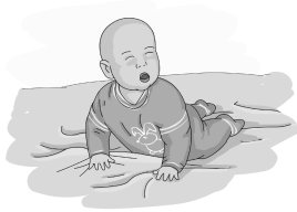
Un nadó té ja prou força per aixecar el cap i l'esquena tot recolzant-se en els braços

Es poden diferenciar tres tipus de to muscular (Castañer i Camerino, 1991):